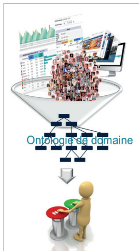
Traitement de l'information dans un processus décisionnel

Projet Semaxone – assistance d'un opérateur humain dans un contexte de surcharge cognitive.